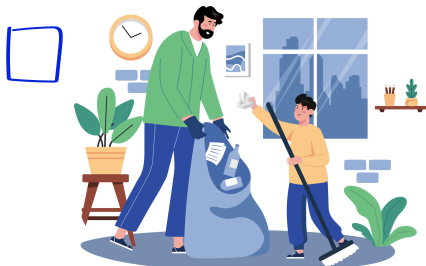
Raccolta dei rifiuti (quando fai una passeggiata)