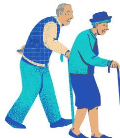
Aiutare gli anziani nella tua comunità