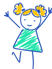
Socializzazione con bambini dei centri sociali