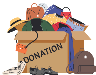
Raccolta e donazione di vestiti e persone in difficoltà