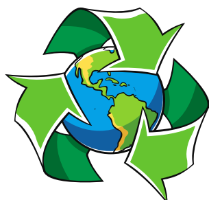
Attività di riciclo