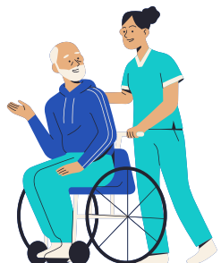
Volontario in una residenza anziani